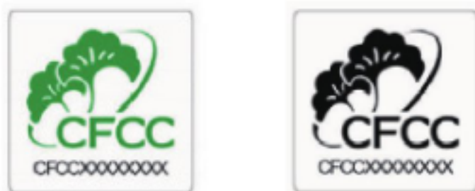
图 B.1 中国森林认证标识

中国森林认证标识样式由图形(包括两片银杏叶、可持续环、CFCC 字母)和标志代码构成,如图 B.1 所示: